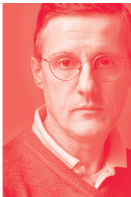
Valerio Varesi

Un apéro littéraire, en l'honneur et en présence de Valerio Varesi, sera organisé au centre Culturel Italien (25 rue Sainte Ursule, Montpellier) ce même jour à 19 heures.