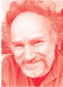
Jeff Pourquoié © Léonie Lob