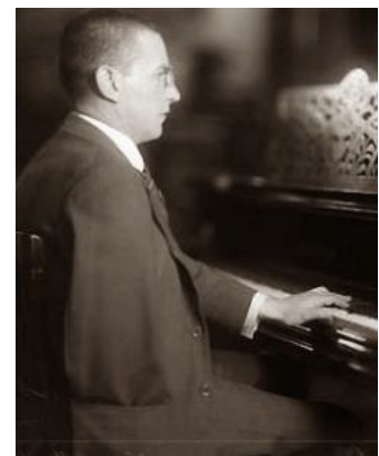
Paul Wittgenstein (1887-1961)