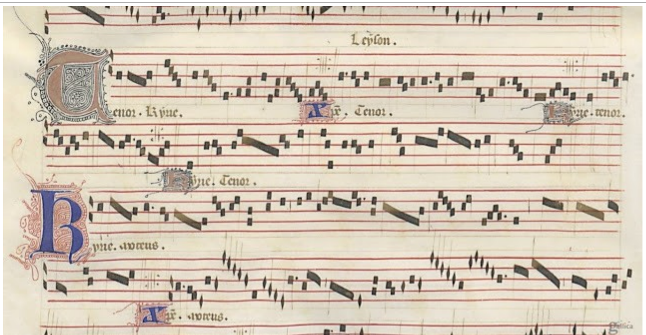
La Messe (Guillaume de Machaut : Messe de Nostre Dame)